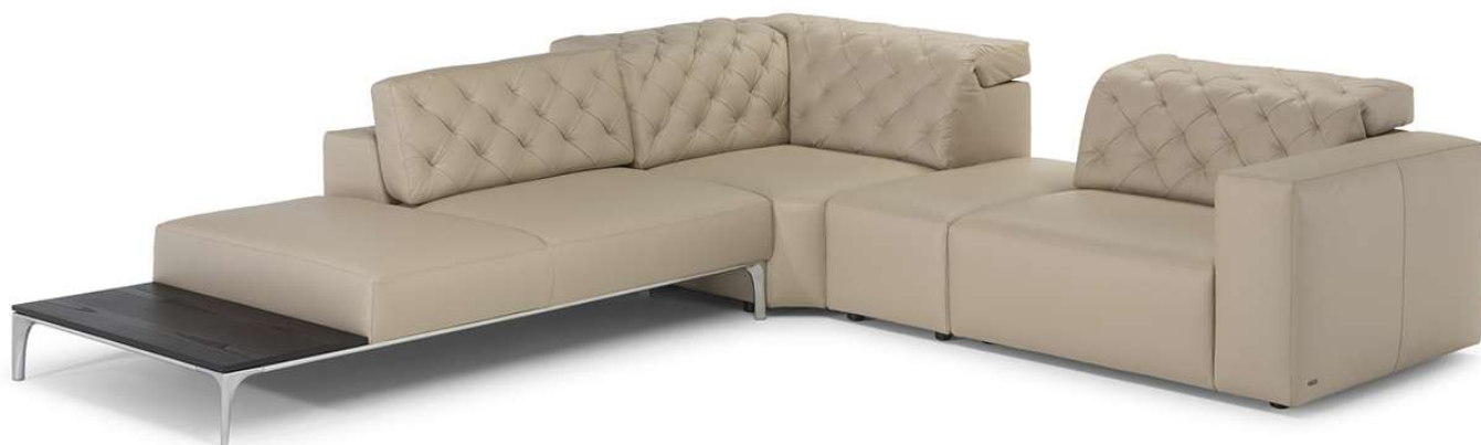
■ Vers. 756+799+311+793