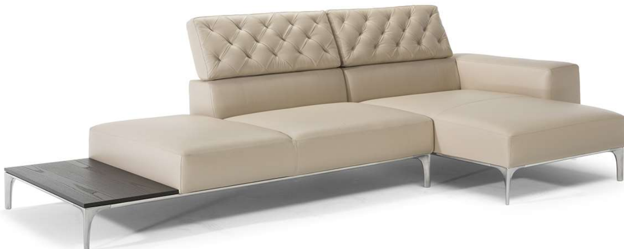
■ Vers. 756+759