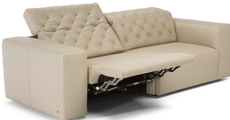
■ Vers. 450+793