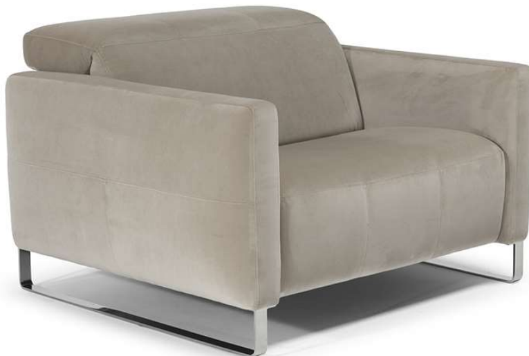
■ Vers. 048