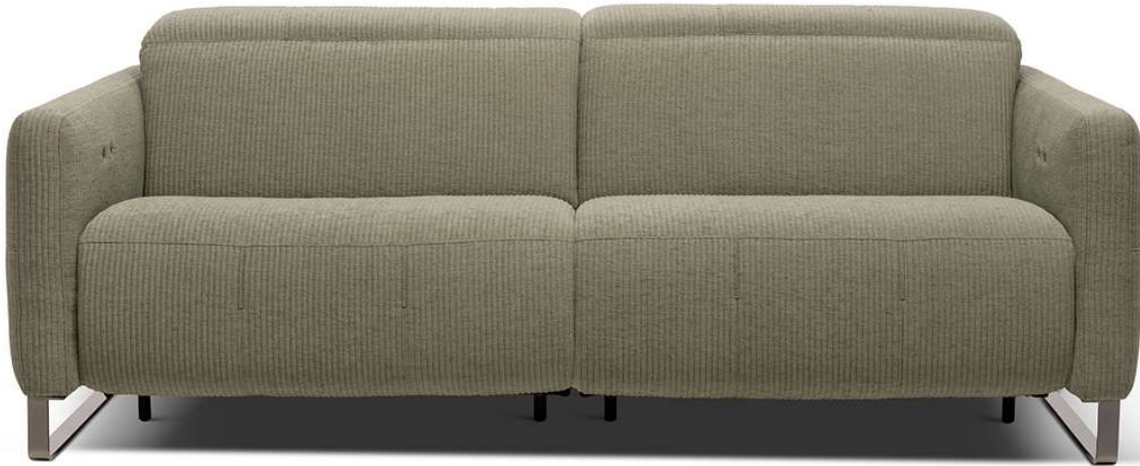
■ Vers. 446