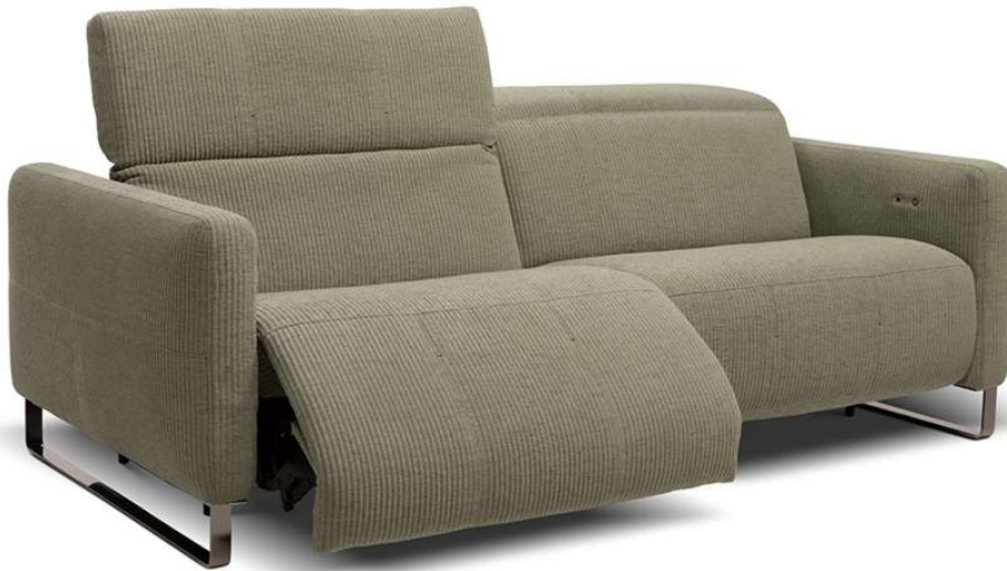
■ Vers. 446