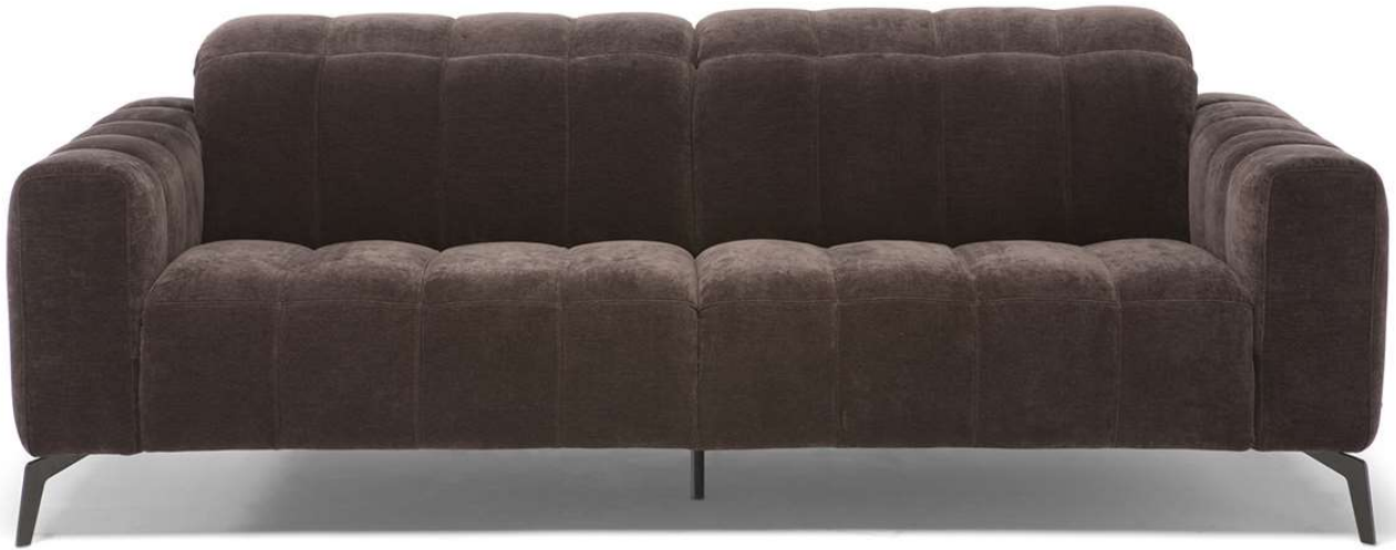
■ Vers. 009