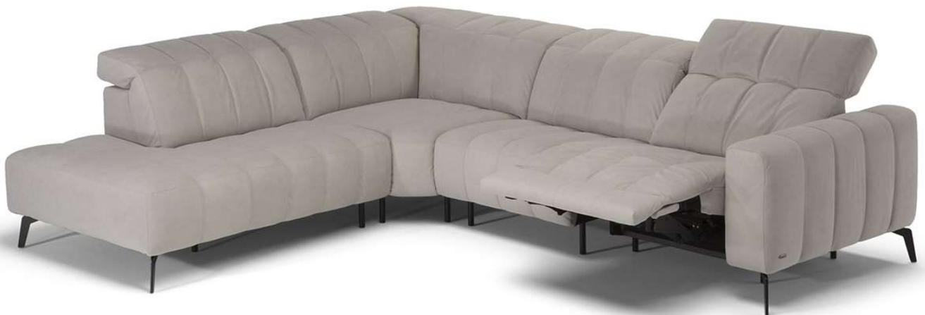
■ Vers. 072+489+483