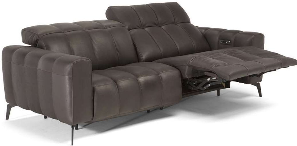
■ Vers. T66