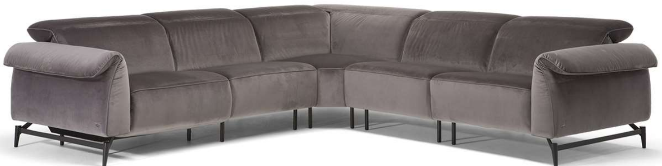
■ Vers. 482+489+291+274