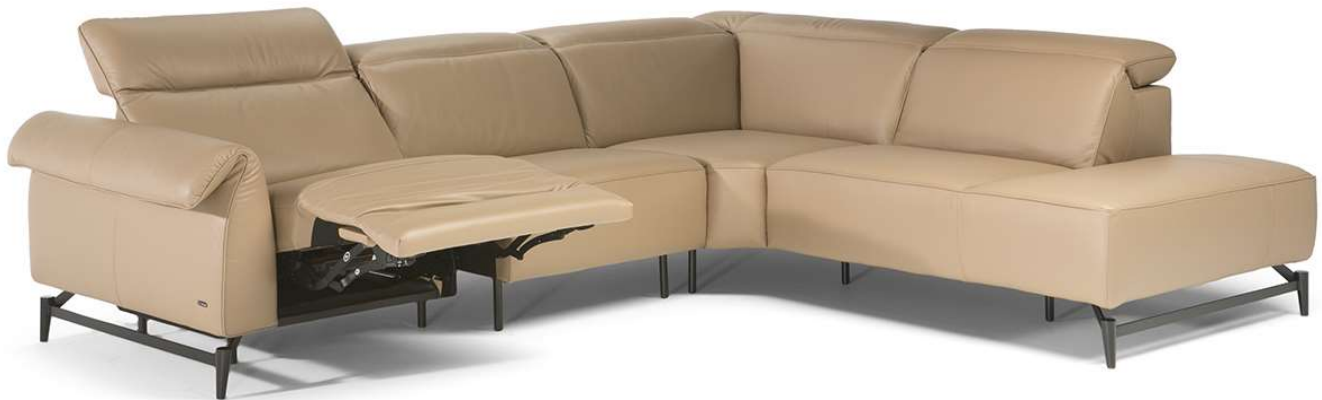
■ Vers. 482+481