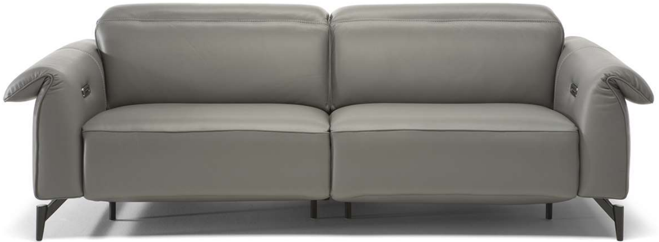
■ Vers. T66