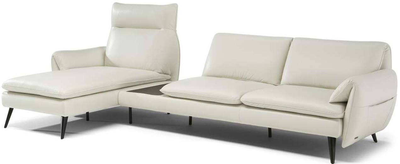
■ Vers. 847+389