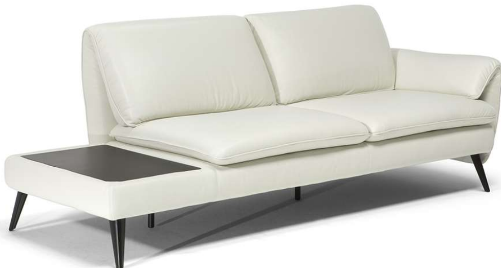
■ Vers. 389