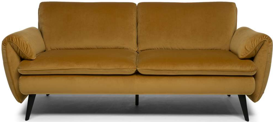
■ Vers. 009