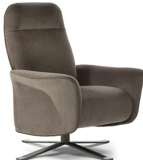
■ Vers. 066