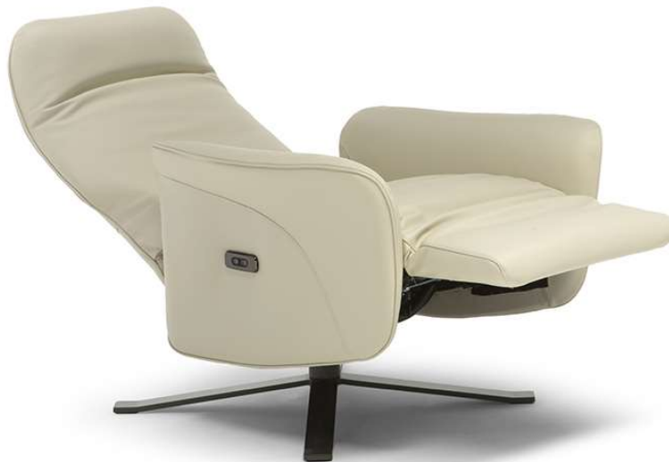
■ Vers. F45