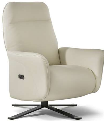
■ Vers. F45