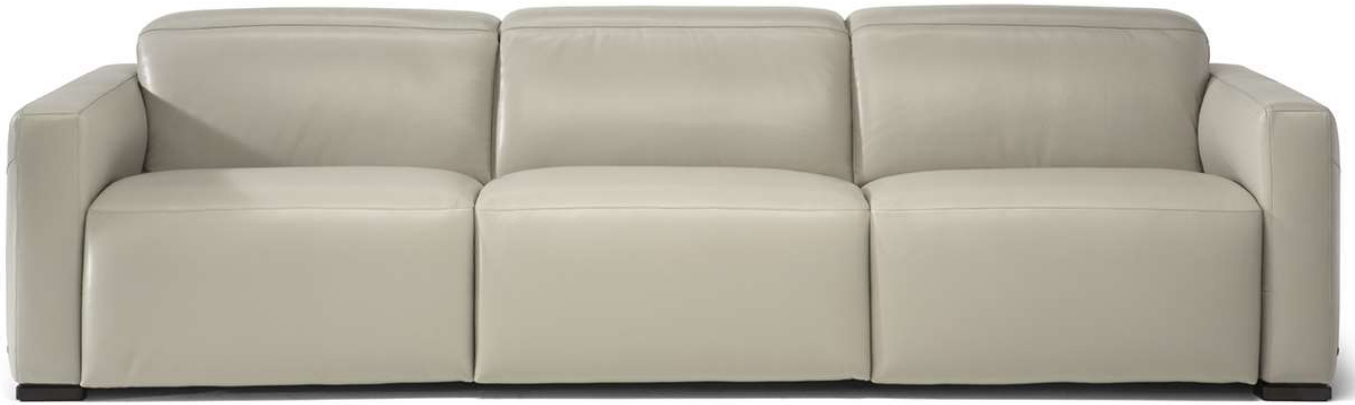
■ Vers. F50+F38+F52