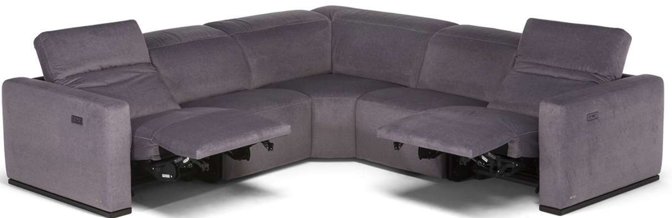
■ Vers. F00+001+489+F25+F02