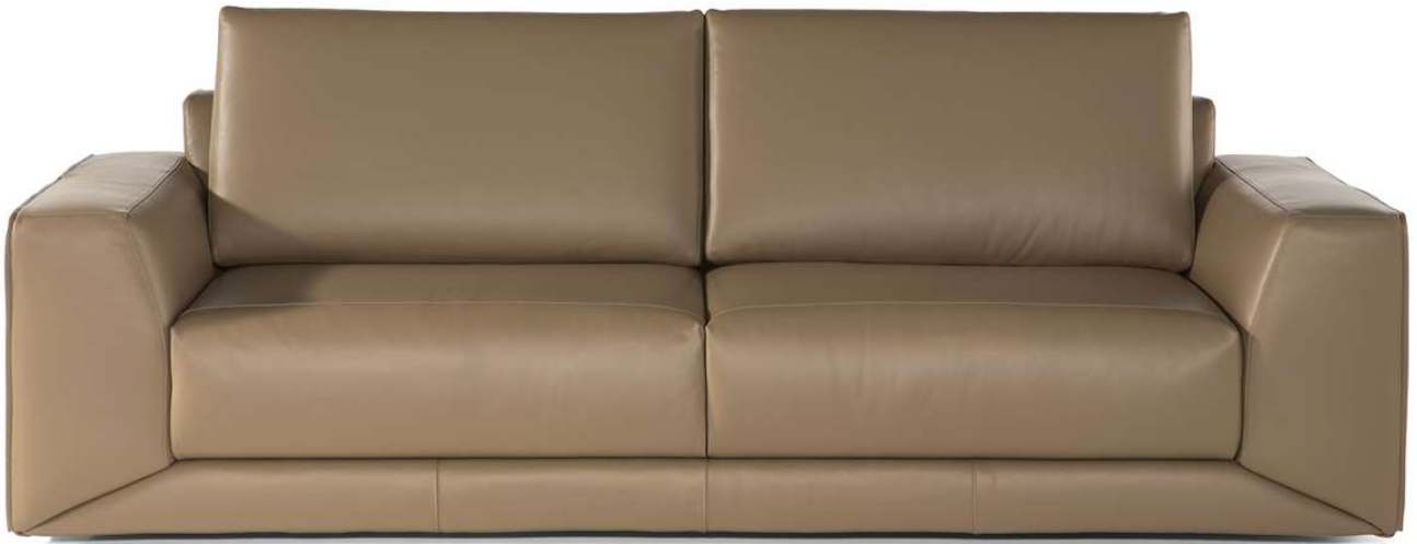
■ Vers. 009