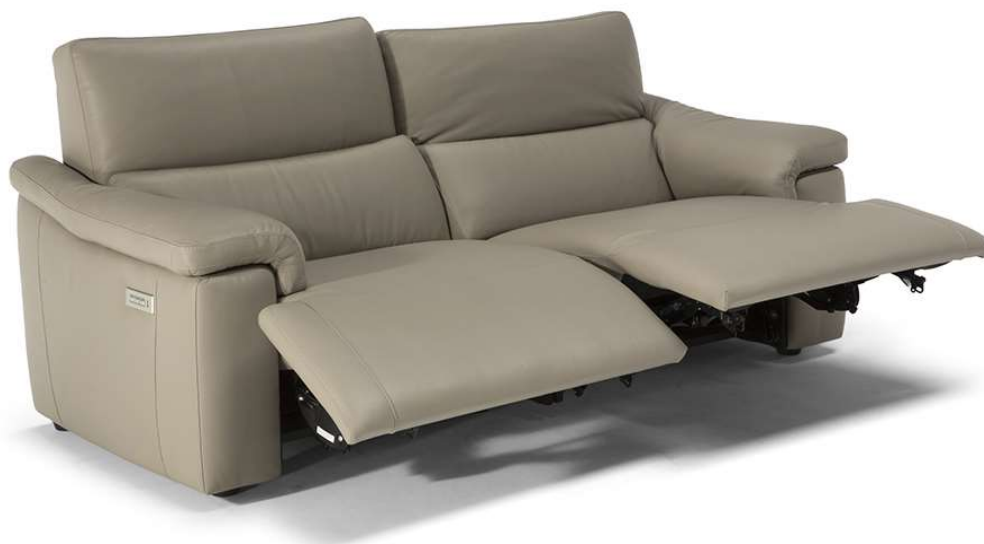
■ Vers. N46