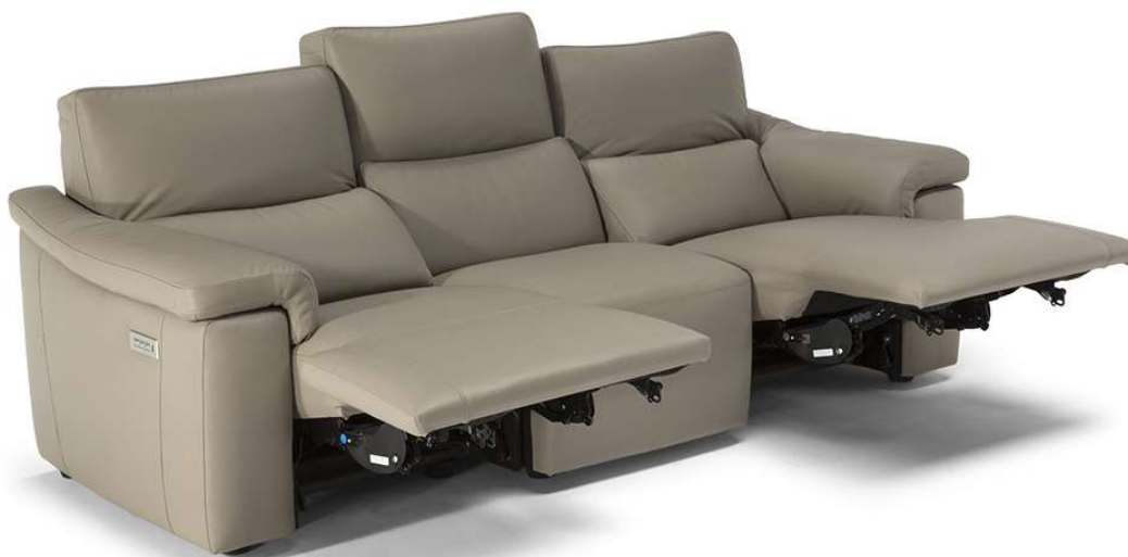
■ Vers. N55