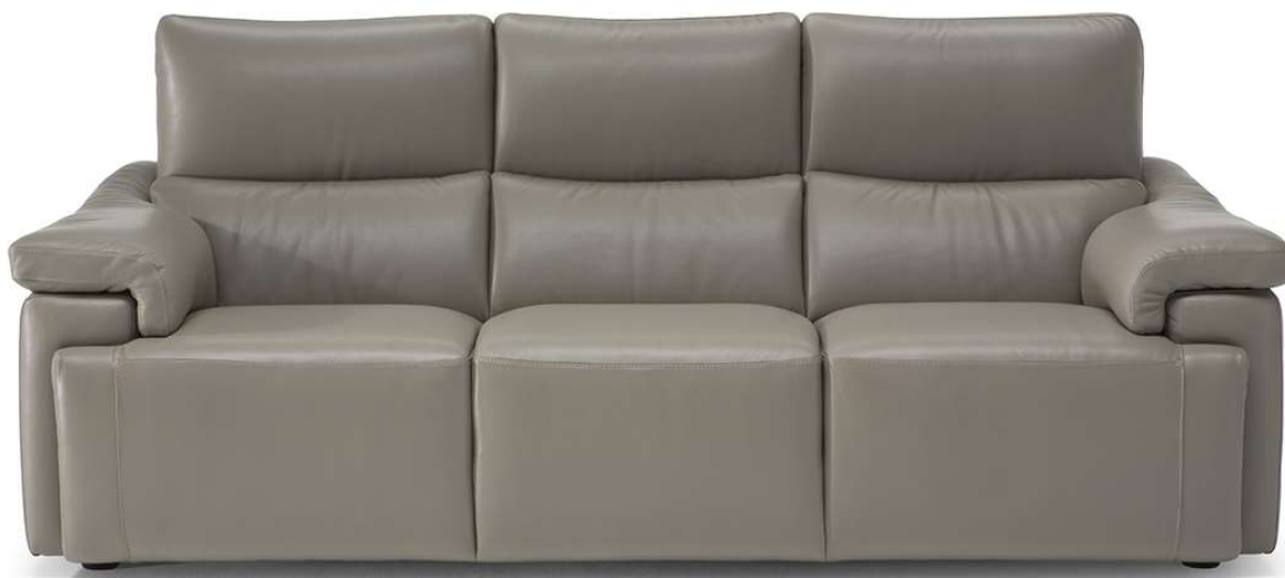
■ Vers. 064