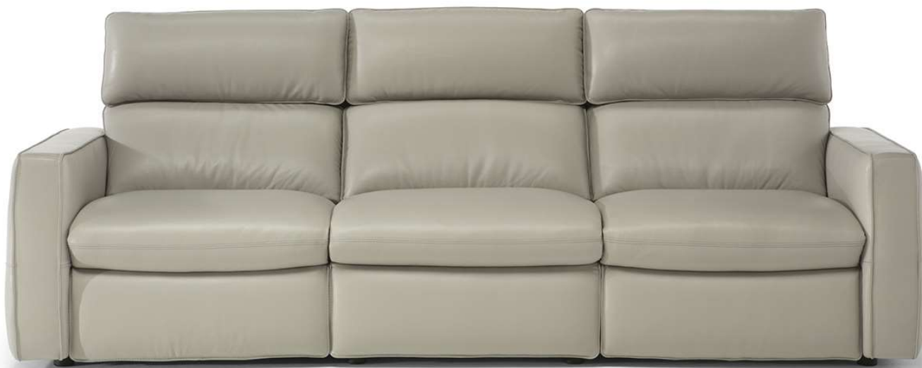
■ Vers. F50+291+F52