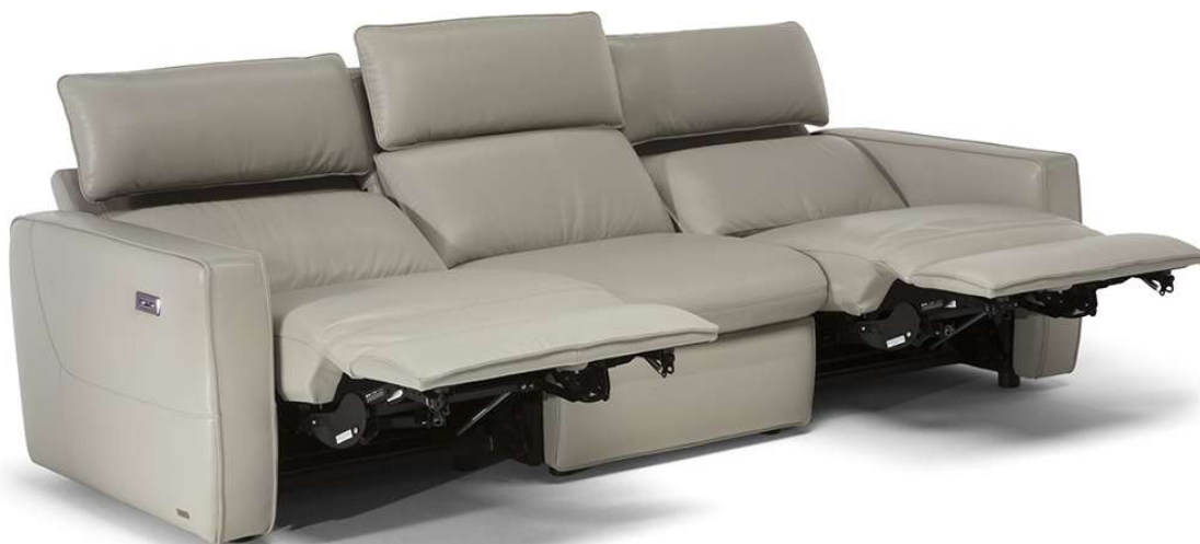
■ Vers. F50+291+F52