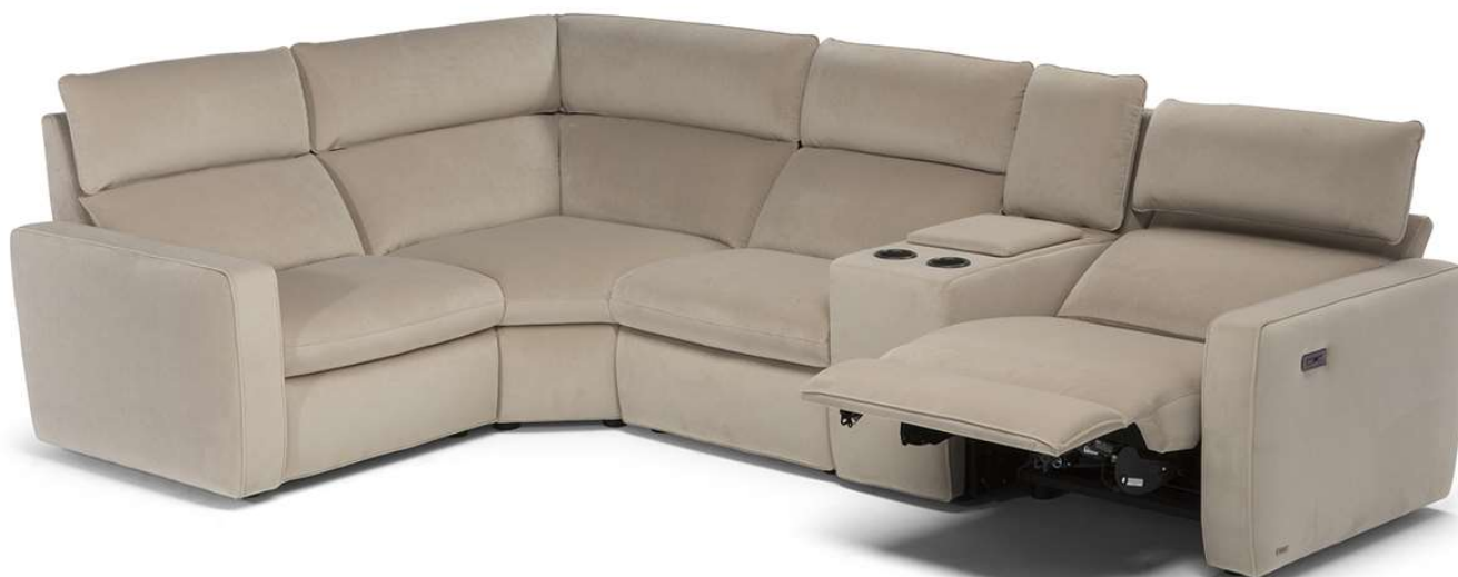
■ Vers. 272+011+291+323+F52