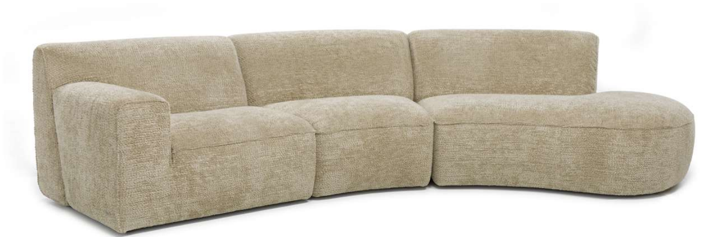
■ Vers. 000+202+221