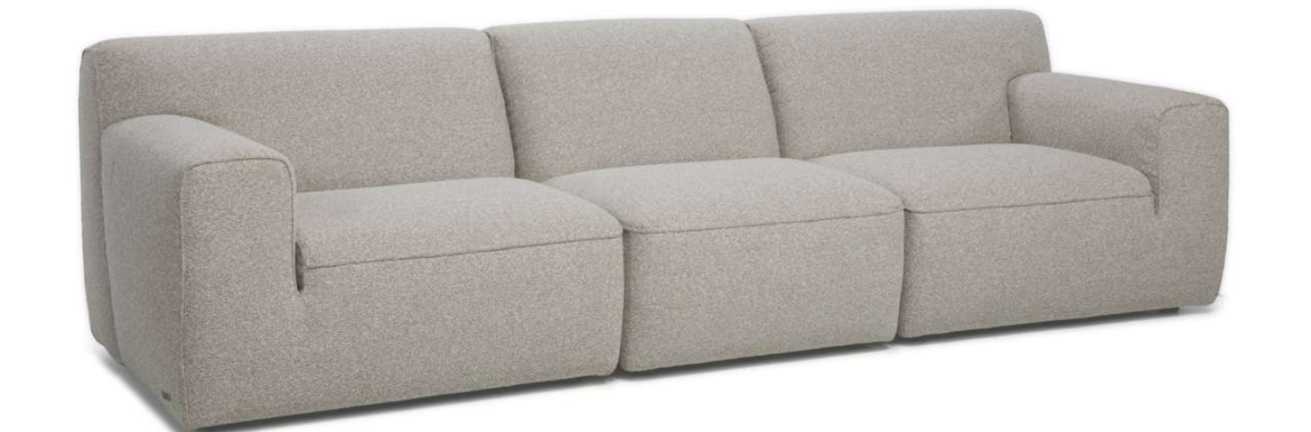
■ Vers. 000+001+002