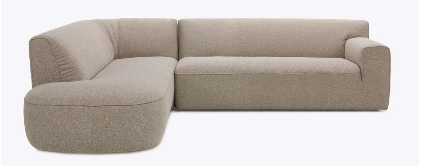
■ Vers. 200+217